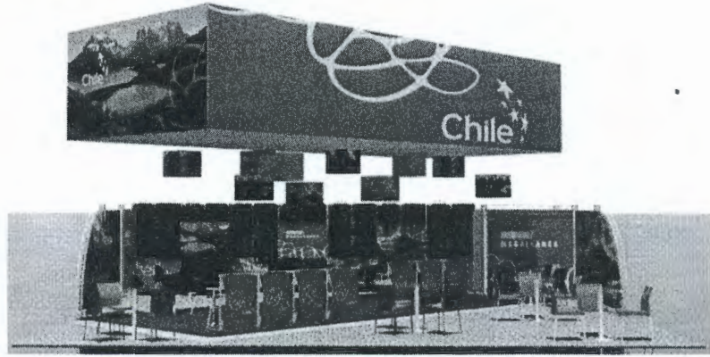
Render Stand Especial imagen referencial

Bajo esta instancia se entregarán libros pictóricos que reflejan y difunden el patrimonio natural de Atacama, se efectuarán charlas acerca de la cultura presente en la región y de los lugares más atractivos e importantes de la zona, destacando la diversidad productos y actividades turísticas presentes. Por otro lado se entregarán degustaciones de productos típicos de la región, como el pajarete, aceite de oliva, chañar, entre otros.