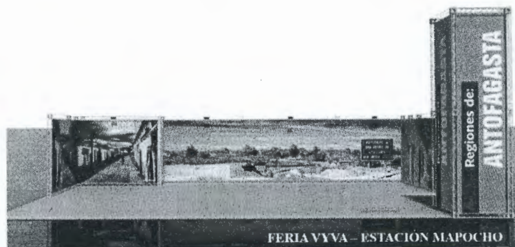
Render Opción A - Stand Básico imagen referencial Antofagasta