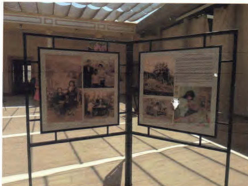
Imagen referencia (incluye bastidor y láminas)