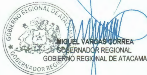
MIGUEL VARGAS CORREA GOBERNADOR REGIONAL GOBIERNO REGIONAL DE ATACAMA